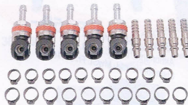
6 A 1807.21-AS

Aktion exkl. MwSt: Fr. 318.- Aktion inkl. MwSt: Fr. 343.50 Listenpreis inkl. MwSt: Fr. 426.60