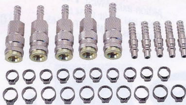
5 A 1801.05-AS

Aktion exkl. MwSt: Fr. 118.- Aktion inkl. MwSt: Fr. 127.50 Listenpreis inkl. MwSt: Fr. 157.40