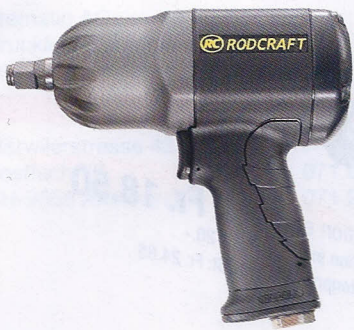
1 RC 2277

Aktion exkl. MwSt: Fr. 295.- Aktion inkl. MwSt: Fr. 318.60 Listenpreis inkl. MwSt: Fr. 410.40