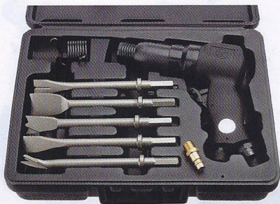
2 RC 5120

Aktion exkl. MwSt: Fr. 340.- Aktion inkl. MwSt: Fr. 367.20 Listenpreis inkl. MwSt: Fr. 453.60